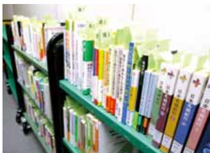
書店から図書館に届いた本