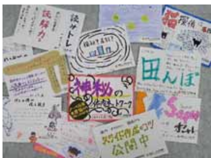
個性あふれる素敵なポップが集まりました

選ばれた本は、図書館スタッフが既に所蔵されていないか、選書ツアーの趣旨に沿っているか等を確認します。受入が決定した本は図書館システムに登録し、ラベルや蔵書印などの装備をします。