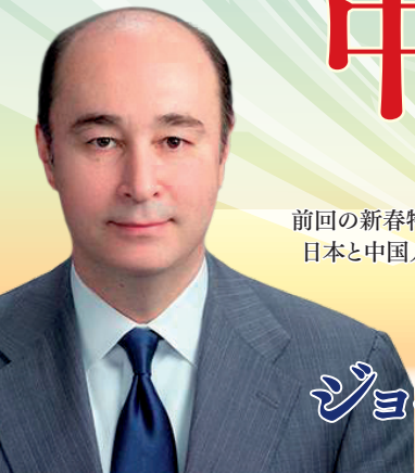
米国経済・政治アナリスト