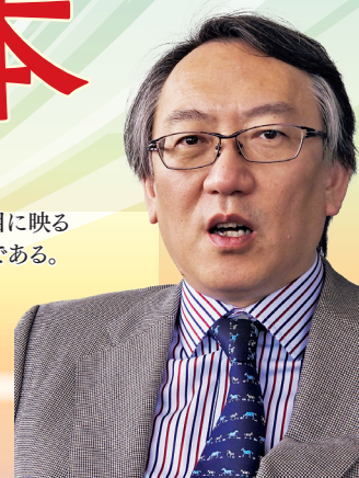
静岡県立大学 グローバル地域センター 特任教授